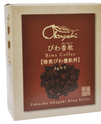
コーヒー びわ香柑