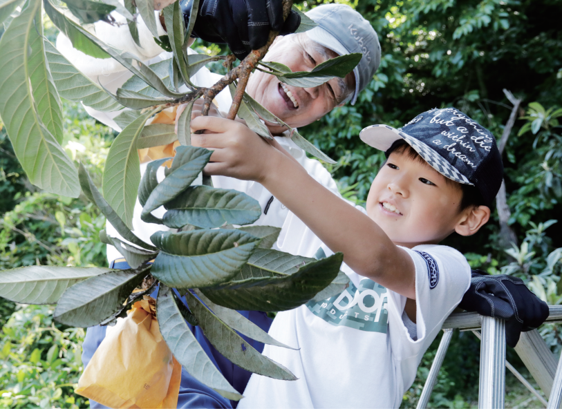
町内の小学校では、授業で高倉びわの袋かけ・収穫体験を行っています。