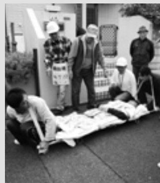
自主防災組織の育成