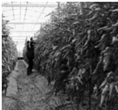
施設園芸農業の支援