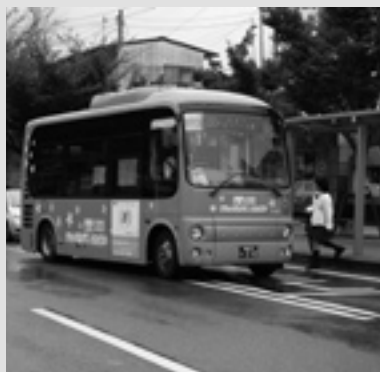
コミュニティバスの運行