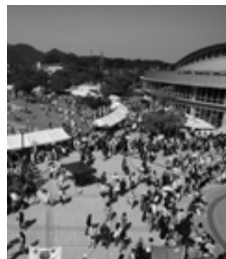
まつり岡垣の支援