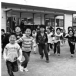
学童保育所の運営