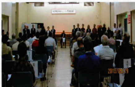
新役員紹介の様子