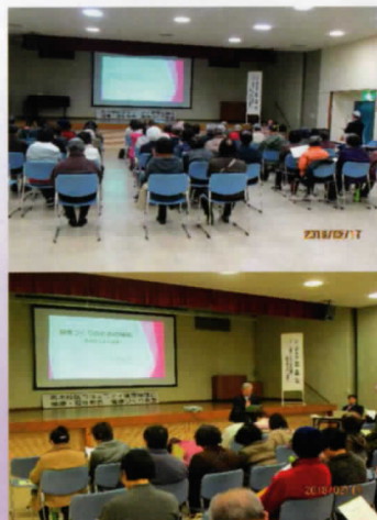
昨年の健康づくり教室

1 健康づくり教室の実施 健康・福祉部会では、今年度も健康づくり教室を3回行う予定です。