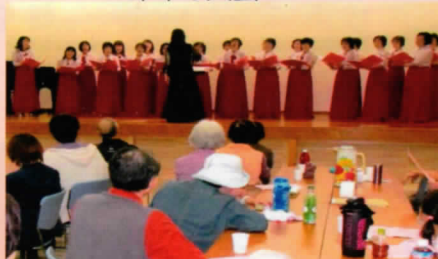
昨年のミニ音楽会