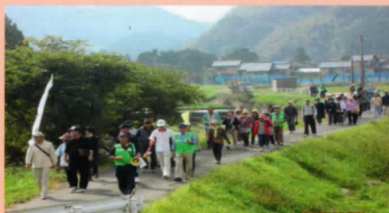
28年のふれあいふる里めぐり