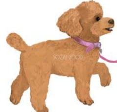
編集部で勝手に想像したムック君