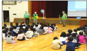
旗の横断歩道にある説明を聞いている一年生(体育館)

当日は、雨天の為に体育館で開催されました。今年も「おんが自動車学校」の先生4名が来校され、1年生は道路の安全な横断の仕方を、4年生は自転車の安全