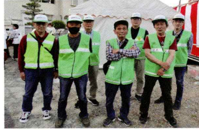
パトロール参加者一同