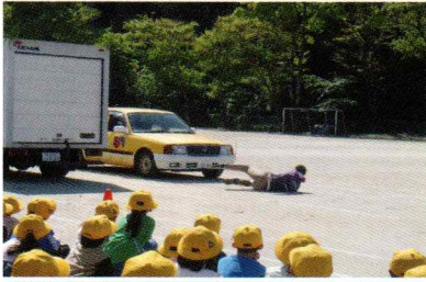
事故の再現で危険性を学ぶ

講師は、おんが自動車学校の先生方で、本物の車やトラックを用いて、一年生には安全な横断歩道の渡り方を、四年生には自転車に乗るときに気を付けることや自転車の点検の仕方、分かりやすく教えていただきました。コミュニティからは5名が参加し、整列補助などを行いました。