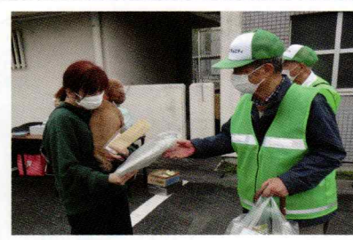
グッズ配付時の様子

飼い主のモラルに訴えるマナーアップ運動として、狂犬病予防集注注射時の4月19日に井堀公園と役場、4月22日に町民総合グラウンドと上畑施設改善センター、4月24日に東部公民館の計5カ所でグッズ(犬のフン袋)を合計115個配付しました。