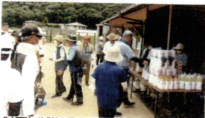
の木のバツ貝田又ワ取ッ