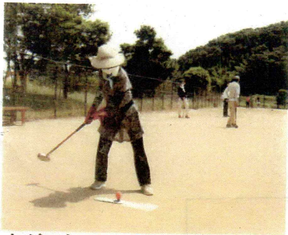
力がこもった一打

岡垣町役場より門司町長・地域づくり課の皆さん4名の参加があり、合計60名で競い合いました。