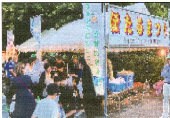
乳垂川を守り育てる活動

高倉神社前広場を受付会場にして、ホタル観賞をメインとした第14回ホタル祭りを開催しました。