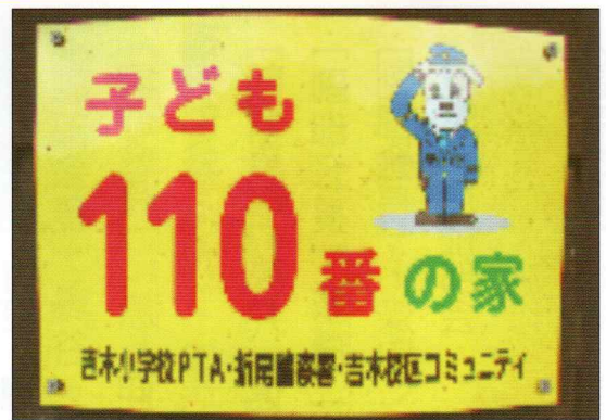
プレートの掲示活動