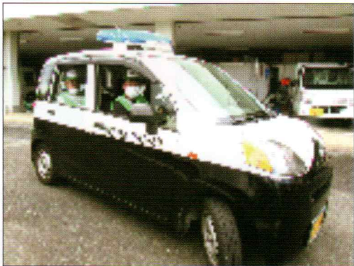
防犯パトロール活動

特に小学生のお子様を養育されているお父さんやお母さんの活動参加をお待ちしています。