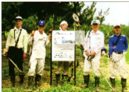
三里松原の保全・保護活動

岡垣町は町の面積52%が森林です。北部は響灘に面し、12kmもの三里松原が美しい海岸線を形成しています。この三里松原防風林