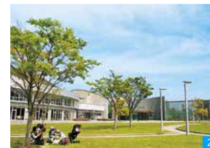
1:子ども未来館では一時保育事業のほかに、子育て中の保護者や児童が交流しています。2:子どもから大人まで利用する岡垣サンリーアイには図書館や芝生広場、遊具もあり、町民の憩いの場となっています。