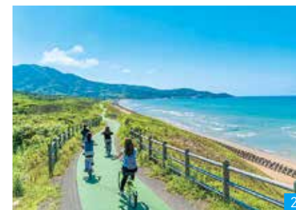
1:季節ごとに変わった姿を見せる山々から望む風景 2:海沿いを走るサイクリングロードは、子どもから大人まで人気のスポットです。雄大な海、潮騒や潮の香りを堪能できます。