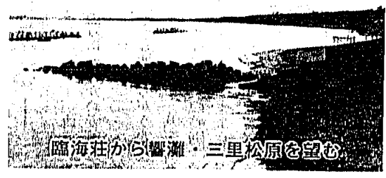
臨海荘から響灘・三里松原を望む