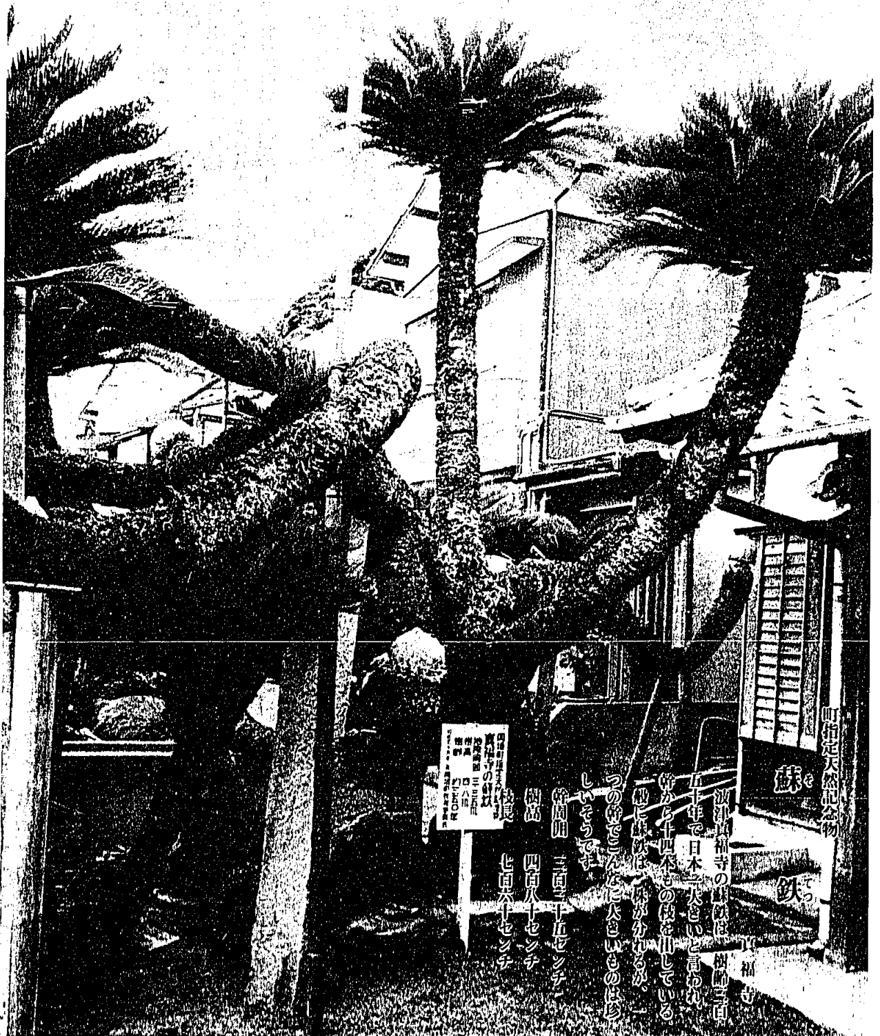
町指定天然記念物

昭和60年9月1日発行 発行所/福岡県岡垣町役場 編集/町長公室 印刷/冷牟田印刷