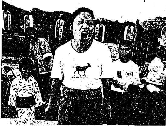
▲「かあちゃん、スゴイ！」大声大会