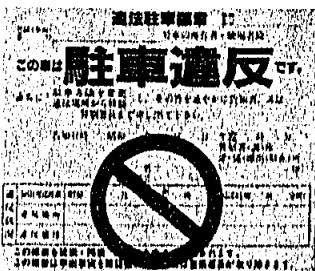
▲ 違法駐車車両に取り付けるステッカー