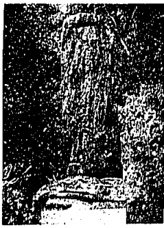
熊野神社境内にある海妻甘蔵の碑