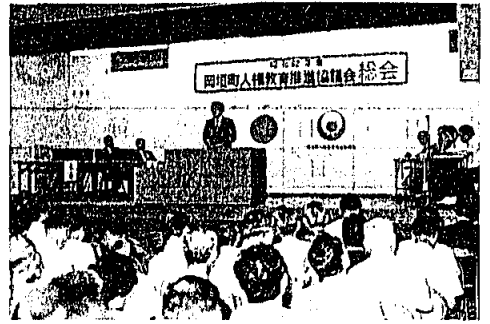
7月16日 人権教育推進協議会