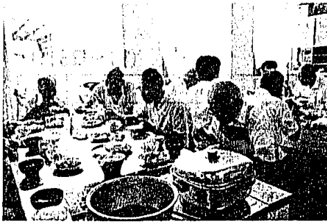
7月24日 老人男子料理実習