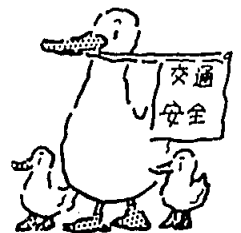
秋の全国交通安全運動 (9月21日〜30日)