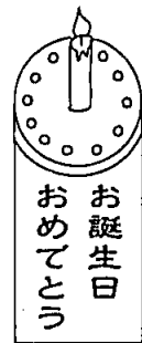
お誕生日 おめでとう