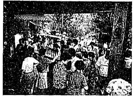
9月15日 龍島寺疋積封じ