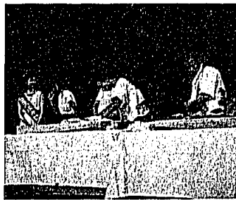
鯛・ヒラメの活造り実演

この日は、よかトピアの「自治体の日」として岡垣町が選定され、リゾートシアターで催しを行いました。