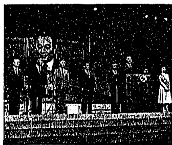
町長による開催のご挨拶