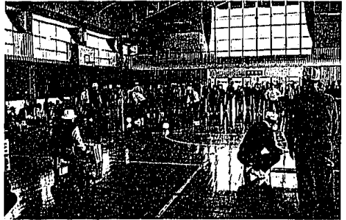
11月21日 老人スポーツ大会

第三回岡垣町老人スポーツ大会(主催 老人クラブ寿会連合会)が開催されました。日頃から運動十分の人も減少に運動しない人も、珍プレーを続けて、スポーツ大会を楽しみました。