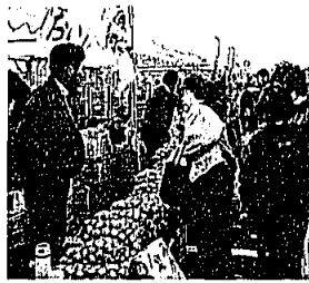
岡垣のみかんも売れてる。