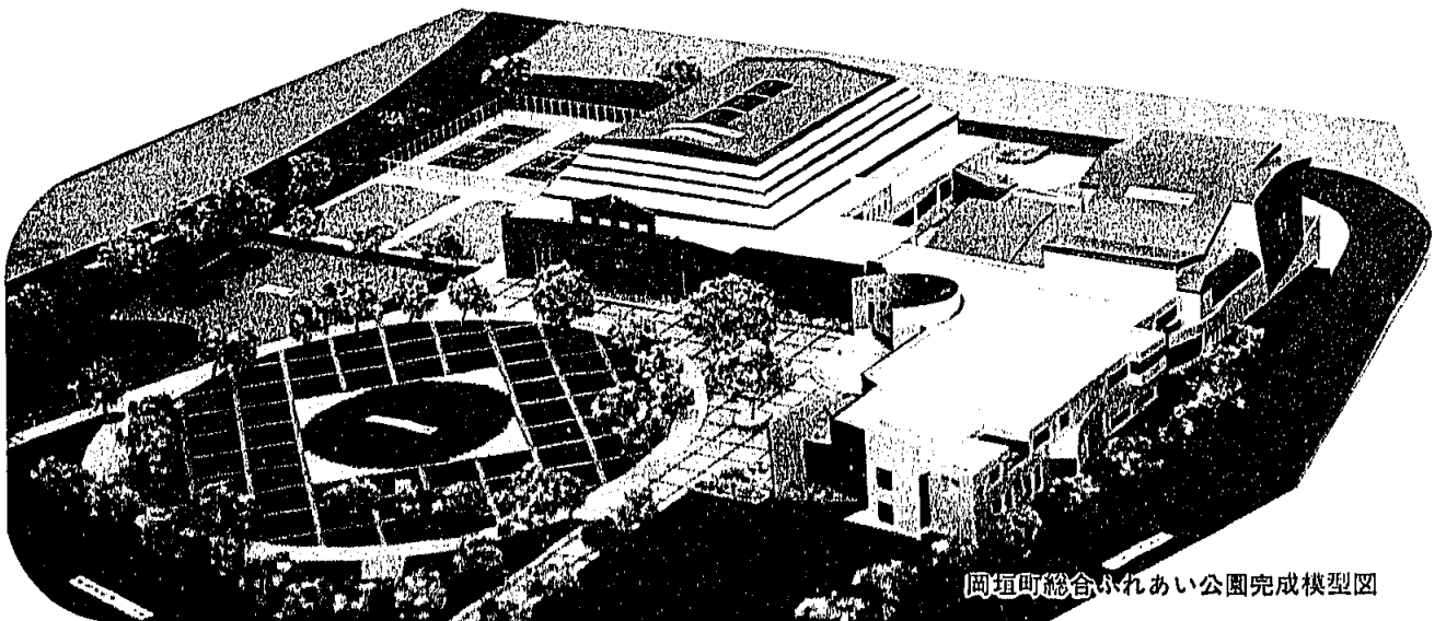
岡垣町総合ふれあい公園完成模型図

役場南側に建設中の、総合ふれあい公園施設(平成5年3月竣工予定)の愛称を募集します。 この施設は、文化会館やコミュニティーセンターなどの複合施設で、町民のふれあいとレクリエーション活動を中心に、人の心豊かなさをはぐくみ、人づくり、町づくりを目指しています。皆さんに親しまれるあなたのアイデアを待っています。