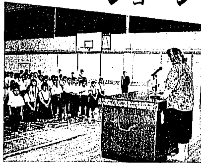
9月1日岡垣中学校で