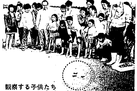
観察する子供たち

7月17日に岡垣町三里松原海岸に産卵したアカウミガメが9月22日午前1時30分ごろ孵化しました。その教およそ50匹、すぐに産卵場所から海へ歩き出し海中へ消えていきました。 ウミガメの産卵から西黒山・東黒山の子供会を中心に海岸の掃除なども実施してきました。