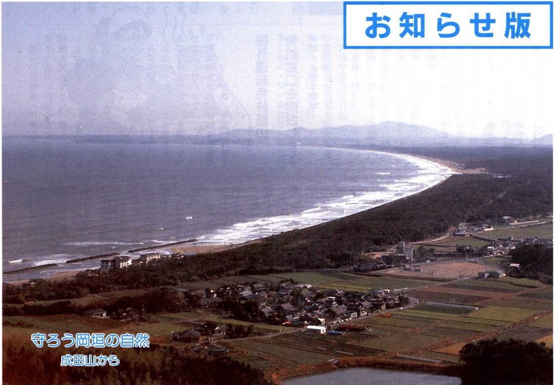
守ろう岡垣の自然 成田山から