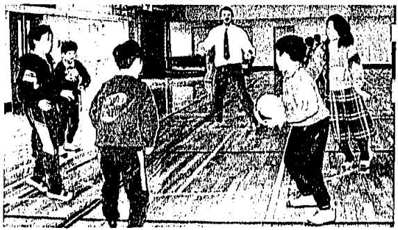
小学校交流（海老浦小学校）

次の広報おかがきにのせます。心配しないで、もちろん名前をのせたりは絶対にしません。みなさんの記事に自分の名前を書かなくていいですよ。毎月、もし、たくさん「反響」の記事をもらえれば一番いいのを選んでのせます。みなさん、本当に自分の心からの考えを聞かせてください。遠慮しないでください。日本と外国の関係はいい印象も悪い印象も知りたいですよ。そのようにすれば、もっと深くお互い理解が出来ると思っっています。なんでも日本と外国の事、また外国についての質問もいんですよ。それと「アレックスの目」の印象もけっこうです。