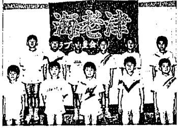
全国大会出場選手