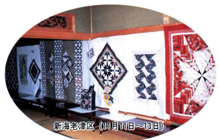
新海老津区 (11月11日～13日)

昨年 （1997年） の文化の日の前後、多くの自治区公民館で文化祭が開 催されました。 会場は、舞踊、民謡を始め水墨画、パッチワーク、盆栽な ど数多くの作品が展示され、訪れた人は芸術の秋にふさわし い素晴らしい作品に見入っておられました。（中央公民館に 提出された写真のみ掲載）