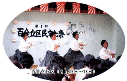
百合ヶ丘区 (9月16日～18日)