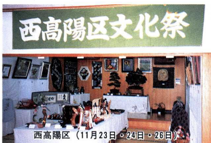
西高陽区 (11月23日・24日・26日)