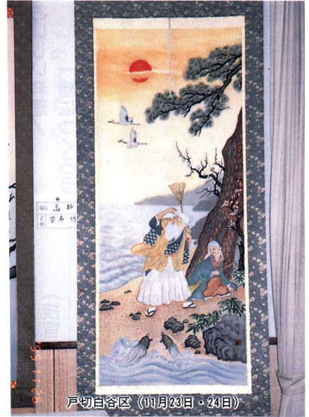
戸切白谷区 (11月23日・24日)