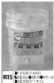
R15 ●浄水容量:307リットル(402H) ●容量:15リットル(402H) ●カラ一歩 ●設置:水栓にフタ付

庭がなくて も大丈夫 生ごみの減量と再資源化のためこれまで屋外用コンポストの補助を行っていましたが屋内用も補助の対象となりました。 容器 二千百円の定価 ポカシ 二千百円の定価 を半額補助します。(容器のみ一世帯2個まで、印鑑持参の事) 申し込みは町民課生活環境係へ