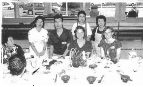
ワールドキッチン

とき 8月17日(月)から8月19日(水)までの3日間。 ところ 日赤福岡県支部 受講資格 満15歳以上で心身ともに健康な人。 参加費 二千元(教材代実費) 持参品 筆記用紙、運動のできる服装。 申し込み 8月17日(月)から19日(水)までの3日間、返信用封筒(宛名記入のこと)を添え、住所、氏名、生年月日、職業を記入 締め切り 8月14日(金) あて先 〒811-1850 3 福岡市南区大楠三丁目1-1 日赤福岡県支部まで ☎092-523-1171へ