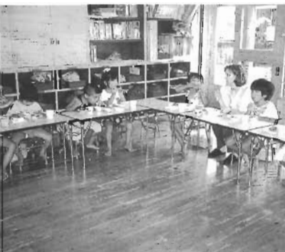
町立保育所訪問 *1997年8月—4歳、5歳の子供達といっしょに交流会と給食