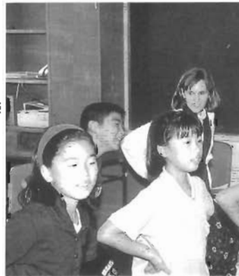
町立小学校国際理解・交流クラブ *1996年10月—海老津小学生がスペインのマカレナの振りを習う