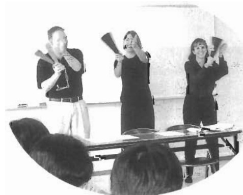
国際事情講座 英語で国際交流！町民が英会話を通して自分のいろいろなテーマに関して外国の先生と話しあって、異文化を理解する *1997年9月—西洋と日本の応援の仕方の比較