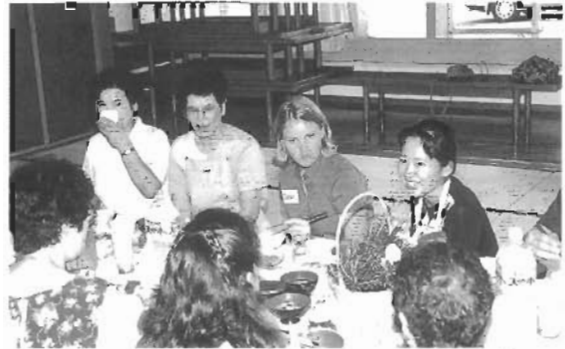
1997年9月 味噌汁とチョコレート・ケーキ！外国の友だちが婦人会から料理を習い、町民の家庭でホームステイ