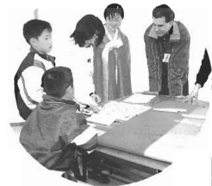
1998年2月 じゃん、けん、ほん、ダイナマイト！ 国際室内ゲーム・テイ家族同士各国のトランプ、すごろくやテーブル・ゲーム体験