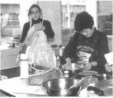
ワールド・キッチン 外国料理はおいしい！ 町民が外国の方から母国の味を習う *1998年2月—アメリカ合衆国の原住民、ホーランド系人やウェトナム系人料理