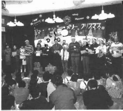
1996年12月、1997年12月 母の家—メリークリスマス！役場の職員から子供たちへのクリスマス会とプレゼント

●中央公民館☎282-0162 ●東部公民館☎282-0035 ●西部公民館☎282-7476 ●社会福祉協議会☎283-2940