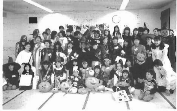
1996年10月、1997年10月 Trick or Treat！小学生と中学生といっしょにアメリカ合衆国風ハロウィン・パーティー