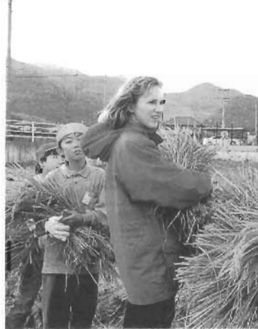
町立小学校訪問 *1996年11月—吉木小学生といっしょに稲刈り *1997年6月—海老津小学校の6年生といっしょにジュニア国際交流員の授業