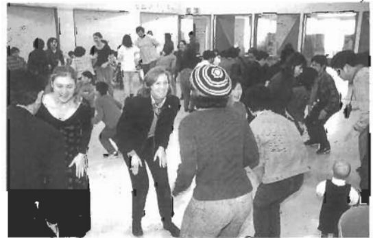
1998年3月 月が出た出た…ヒールアンドトー、ヒールアンドトー、スライド、スライド、スライド、スライド！外国の友だちとホームステイし、踊りて世界一周