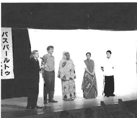
1998年5月 バスパールトゥ教育劇団が来日！イギリス人、ブラジル人、ケニア人、バングラデシュ人と岡垣の中学生や町民が同じ舞台上に演劇出演

もし、ニューヨーク、ワシントンなど旅行される予定がありましたらぜひご連絡ください。案内します。さいごに岡垣町の国際交流の発展と皆様の健康を願っています。さようなら。