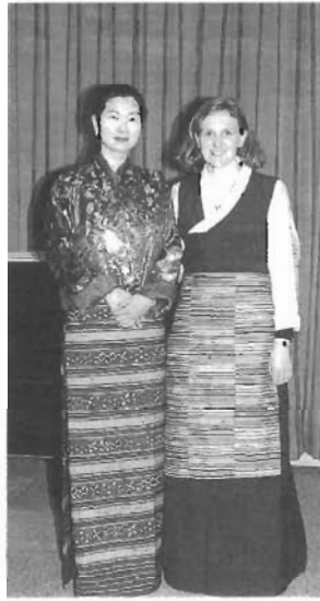
ハリウッド・ナイト 外国の映画はおもしろい！町民が国際交流員といっしょに映画に関する講義と字幕スーパの映画鑑賞で外国のことを習う *1998年4月—フータンやネパールの民族衣装と生活の紹介