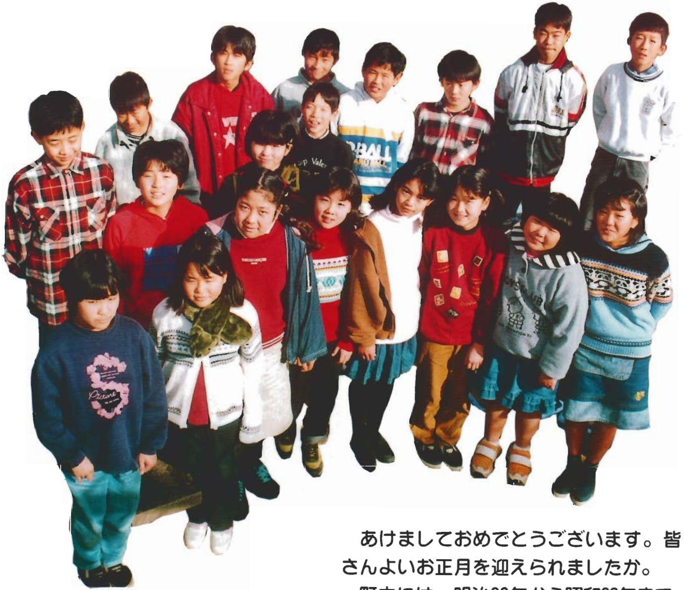
(内浦小学校 5・6年卯年の児童)