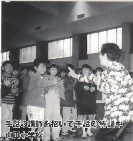
手話の講師を招いて手話の特訓中 山田小学校