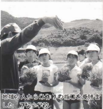
地域の人から菜作りの指導を受けました 豆切小学校