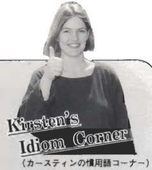
Kirsten's Idiom Corner