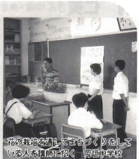
花の栽培を通してまちづくりをしている人を講師に招く 岡垣中学校