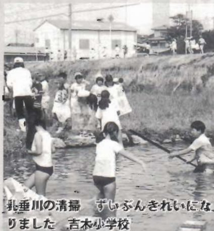
乳垂川の清掃 ずいぶんきれいになりました 吉本小学校