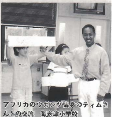
アフリカのウガンダ出身のティムさんとの交流 海老津小学校