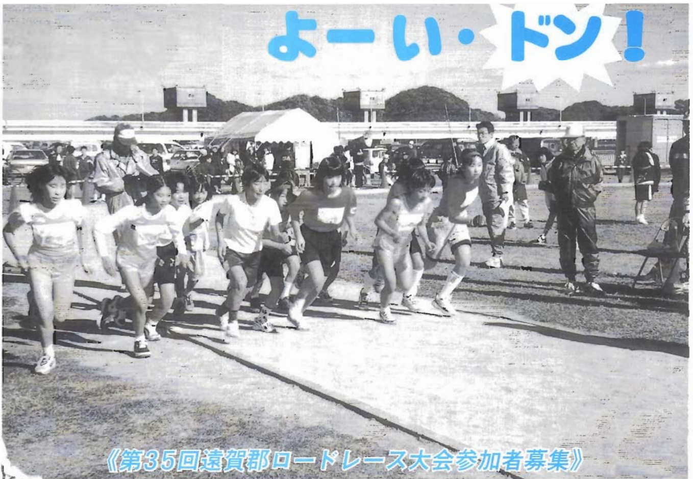
《第35回遠賀郡ロードレース大会参加者募集》