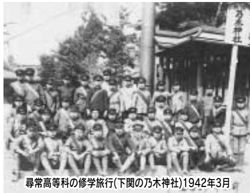
尋常高等科の修学旅行(下関の乃木神社)1942年3月

その後、号令で、鍬を使って、農作業のまねをした。この様子を視察する人たちがいた。だから、事前に、砂場で、畝づくりの練習を何度もし