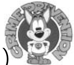
防犯マスコット「CPくん」

また、部品盗は、折尾署管内で64件（前年比 + 9件）岡垣町内で11件（同 + 4件）発生しています。