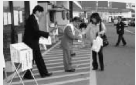
募金を訴えかける町長

10月23日に発生した新潟県中越地震の被災者へ義援金を送ります。義援金は日本赤十字社などを通じて被災地に送られます。