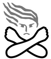
女性に対する暴力根絶のためのシンボルマーク