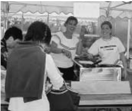
母の出身国、コロンビアの料理(パタコン)を紹介しました