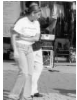
みんなでサルサを踊りました