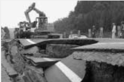
大きな被害がありました