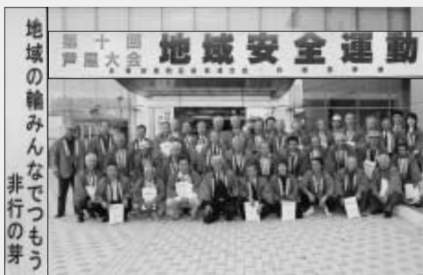
▲大会は、芦屋競艇場内夢リアで行われました。

街頭犯罪が数多く発生している今日、地域安全活動の推進役として、関係機関や各団体と手を取り合って、犯罪のない「明るく、住みよいまちづくり」に務めることを宣言しました。この大会は、来年岡垣町で開催される予定です。