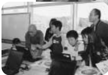
▲情報ボランティアによるパソコンを使ったうちわ作りも大盛況。