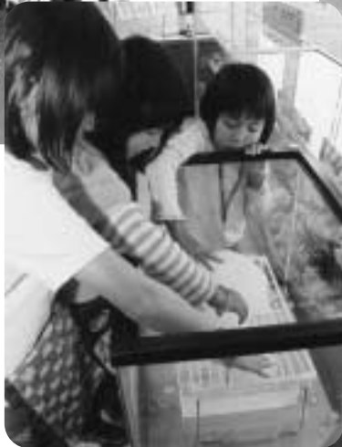
▲南極の氷をさわる子どもたち。