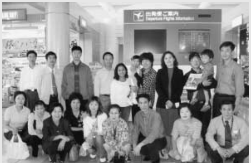
ホームステイを受け入れた岡垣国際交流協会と慈溪市のみなさん