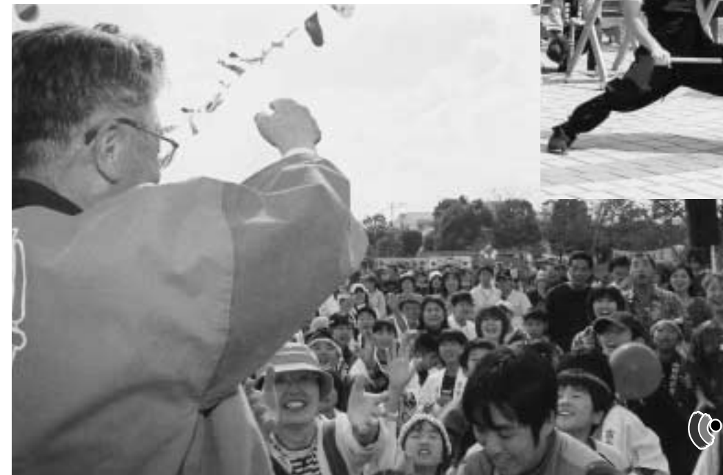
◀毎年恒例となったもちまき。広場は人で埋め尽くされました。