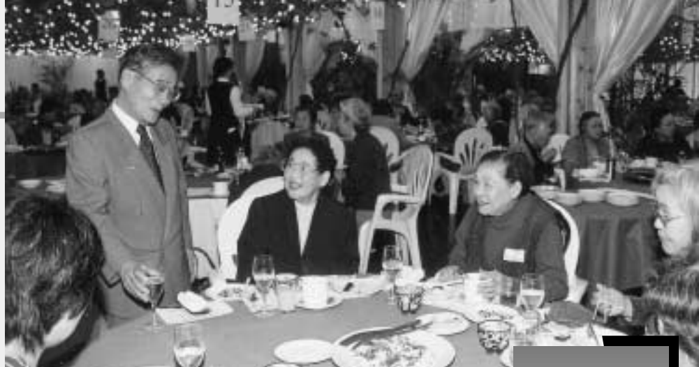
▲参加者は町長との歓談にも笑顔が絶えませんでした

一人住まいの高齢者の社会参加の促進とふれあい交流を目的に、岡垣町社会福祉協議会が行ったこのつどいには、町内在住の75歳以上の一人住まいの人134人と民生委員の34人が参加し、食事や音楽を楽しみました。