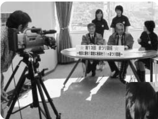
▲情報プラザ放送スタジオから各公共施設にまつりをPR。