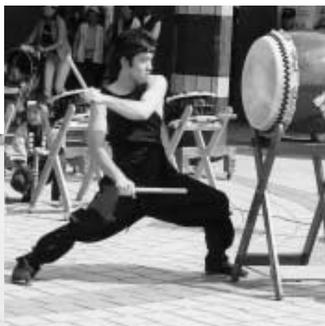
岡垣海鳴り太鼓がまつりを盛り上げます。▶