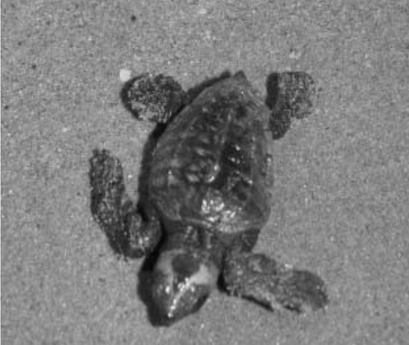
▲6年ぶりにウミガメが帰ってきました

私たちは、三里松原や孔大寺 このだいじ の山々をはじめとする豊かな自然の恵みを受けて生活しています。この豊かな環境を守り、次世代に引き継いでいくため、町・町民・事業者がお互いに役割を担いながら協働して取り組んでいます。