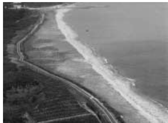
▲三里松原は私たちの財産です