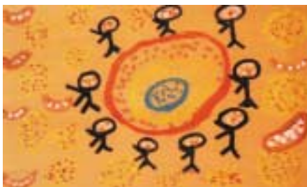
▲戸切小学校の児童が描いたアボリジニーの絵▲

子どもたちの絵は岡垣サンリーアイの図書館に展示していますので、ぜひ見に行ってください