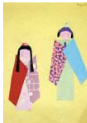
▲オーストラリアの子どもが作ったちぎり絵