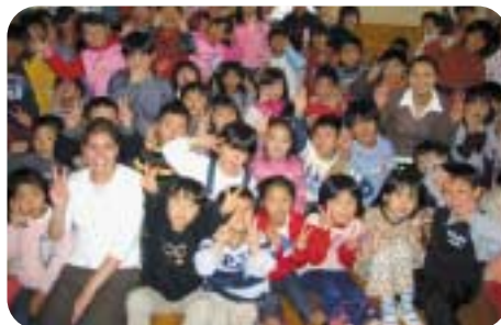
▲山田小学校にて。みんなにたくさん元気をもらいました