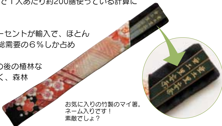
お気に入りの竹製のマイ箸。ネーム入りです！素敵でしょ？