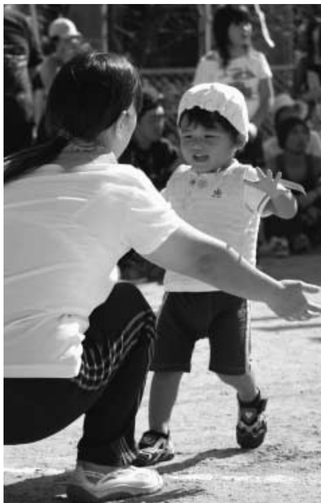
平成19年1月1日から5歳未満の乳幼児医療費が無料になります (写真は中部保育所運動会から)