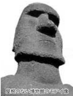
屋根のない博物館のモアイ像