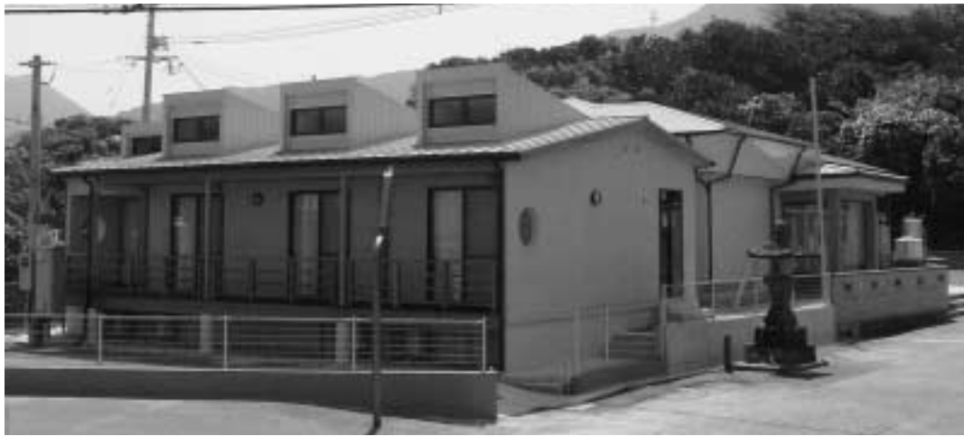
問い合わせ 健康福祉課へ