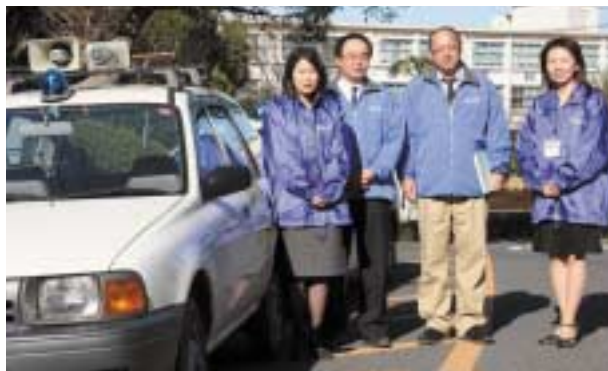
▲職員が順番で回ります