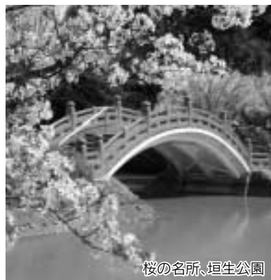
桜の名所、垣生公園