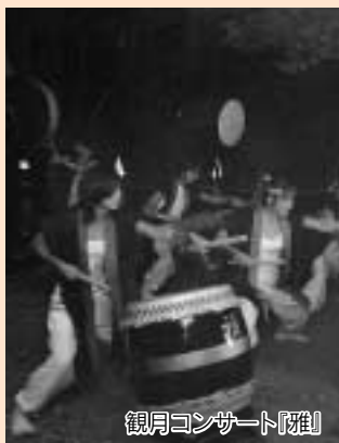
観月コンサート附随