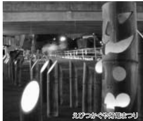
えびつかぐや灯籠まつり

をしています。また、初心者から上級者まで役立つ各種パソコン講座、ブックカバやペーパークラフトなどが作れる「創作工房人の駅」など、楽しい催しが行われています。