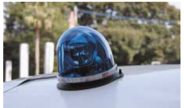
▲この青色回転灯が目印