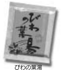
びわの葉湯 岡垣町の特産品 「びわ」のイメージ商品