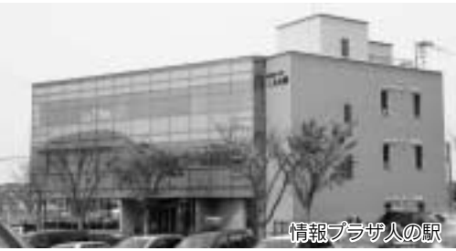
情報プラザ人の駅

館内には、インターネットやパソコン学習が無料でできる、インターネット・マルチメディア体験コーナーのほか、国際交流や商工観光の情報コーナーや会議室・研修室があります。また、地域情報などの映像収録と編集ができるスタジオもあり、町内外に情報発信