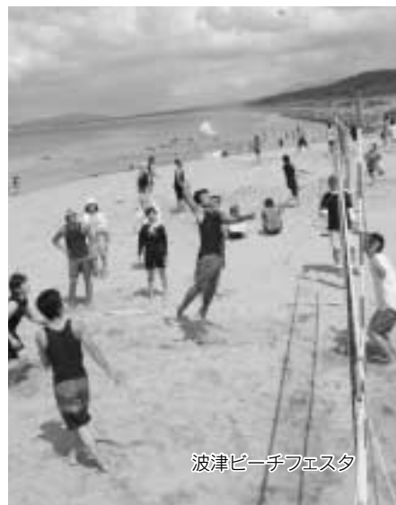
波津ビーチフェスタ

す。7月下旬には波津ビーチフェスタが開かれ、ビーチバレーボール大会などが催されています。周辺にはイカなどの響灘の海の幸が味わえるところもあり、町内外から観光客が訪れます。また、海水浴場の西側は、サーフィンのメッカとして若者に親しまれています。