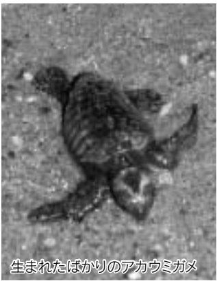
生まれたばかりのアカウミガメ

そして、波津海水浴場。ここは、環境省の全国の快水浴場百選に選ばれるほど美しい浜辺で、毎年6月のラブアースクリーンアップ運動などで清掃活動が行われています。