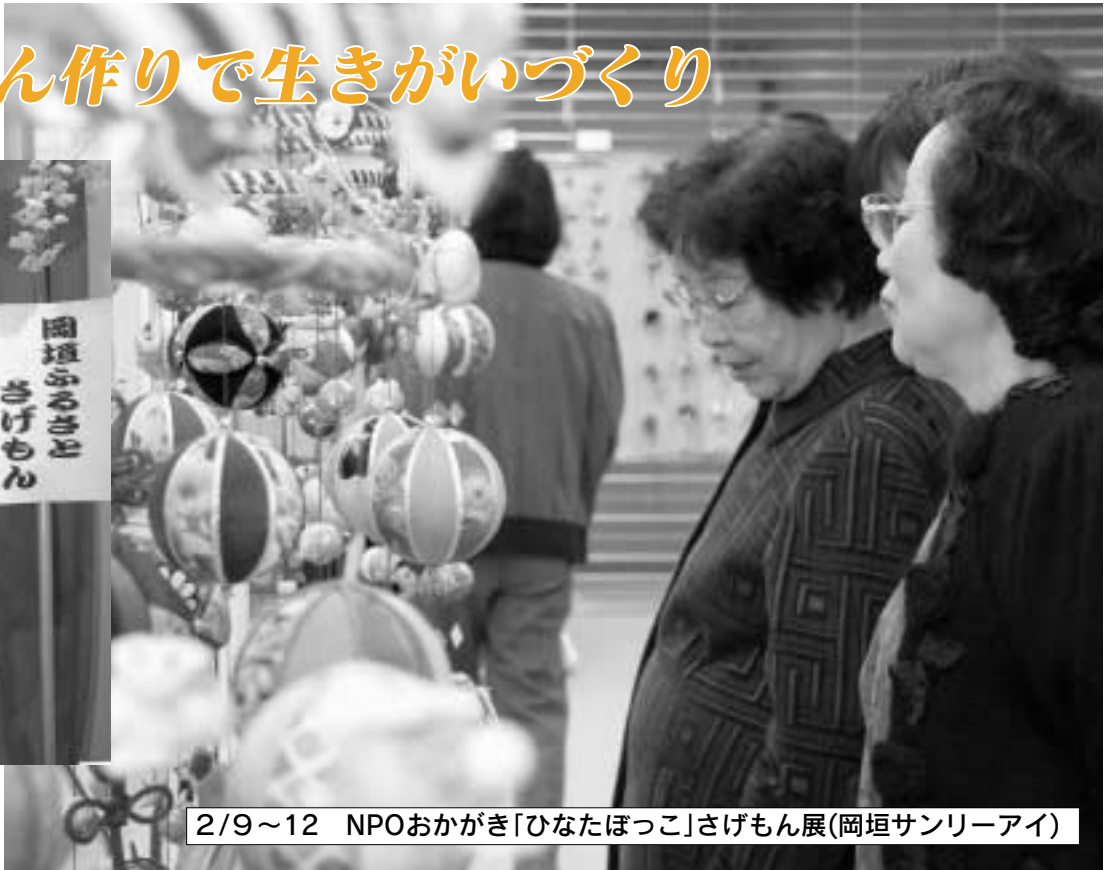
2/9～12 NPOおかがき「ひなたぼっこ」さげもん展(岡垣サンリーアイ)

高齢者の生きがいづくりとして、70歳以上対象のさげもん(ひな飾り)教室をはじめ、1年をかけて少しずつ作りました。