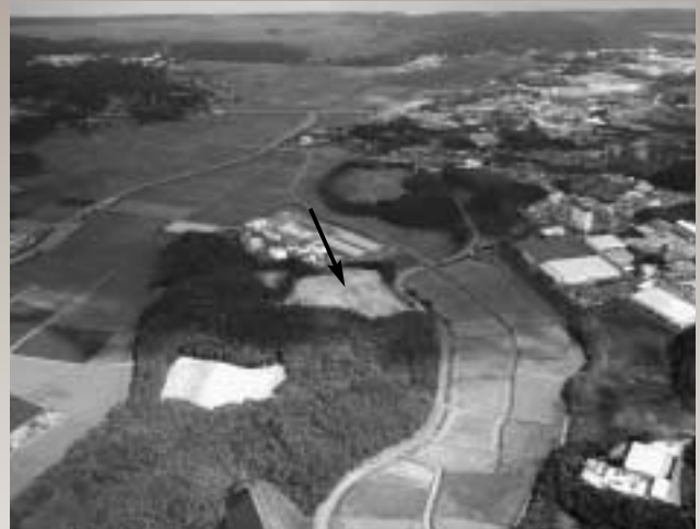
友田遺跡群1区空中写真 調査区全景南から

友田遺跡群1区では住居が多く、ここに住んでいた住人の墓地が南ノ前古墳であった可能性もあると考えられます。調査区の西側斜面(墓ノ尾遺跡群側)では鉄滓が少量ですが見付かっています。8世紀(奈良時代)には、この遺跡が瓦工人、製鉄工人の宿舍であった可能性も十分に考えられます。 近年の岡垣町・遠賀町の発掘調査結果から、芦屋町・遠賀町・岡垣町にまたがる低丘陵地、いわゆる芦屋台地の歴史的な位置付け、重要性が高まっています。