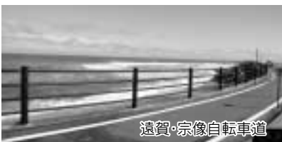
遠賀・宗像自転車道

海水浴場から西に進み、波津漁港の前を通り過ぎると、オーシャンビューが広がるドライブスポットがあります。季節により色合いが変わる波の美しさと、輝く朝日、