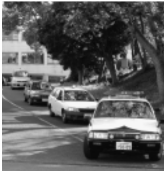
町内の安全を守ります!