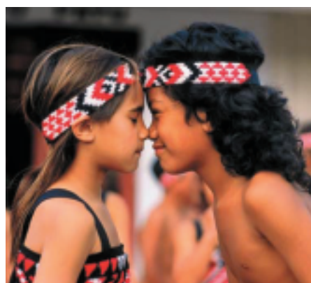
▲マオリの伝統的なあいさつ、ホンギ。お互いの鼻をタッチすることで、人生を分かち合い始めるという意味を持つ

その後、マオリ族の人口が増え、場所によって部族に分かれ、部族同士で戦うようになりました。この時期から、マオリ族の伝統的な踊り「ハカ」が生まれたと言われています。ハカは自分の部族に自分の力を信じさせ、相手を脅えさせるための出陣の踊りだそうで