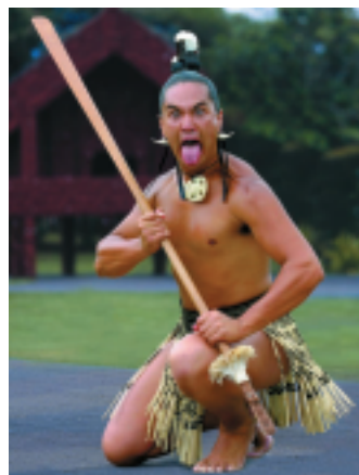
▲昔は武器だった「タイアハー」。今は踊りの道具として使われている

その後、マオリ族の人口が増え、場所によって部族に分かれ、部族同士で戦うようになりました。この時期から、マオリ族の伝統的な踊り「ハカ」が生まれたと言われています。ハカは自分の部族に自分の力を信じさせ、相手を脅えさせるための出陣の踊りだそうで