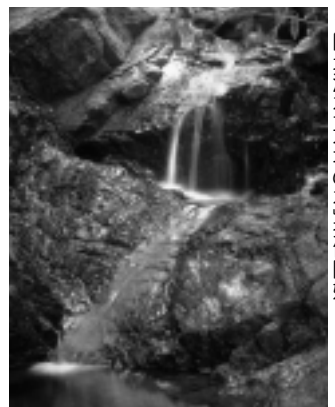
◀岡垣源水「大地の水」提供開始