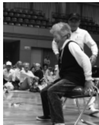
◀高齢者スポーツ大会