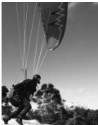
◀パラグライダー15年振りに復活