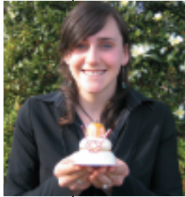
鏡餅ルーシーからの お年玉 (俳句風)