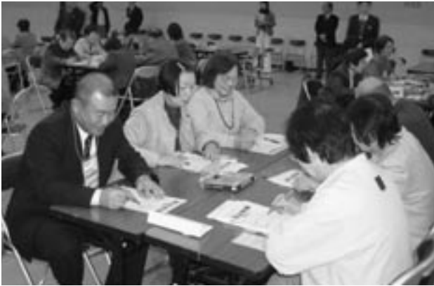
▲11月22日合同研修でワークショップを体験

しが使われていて、97%が中国産です。しかも日本人好みに合うように漂白されています。特に正月に使う柳ばしの原料は「泥柳 どろやなぎ 」。その名のとおり泥の中で育つからしっかり漂白しないと、真っ白にならないそうです。ゾーッとしませんか。