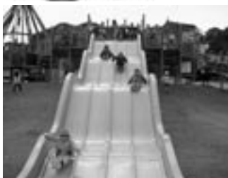
《ふれあいの森公園・宗像市》