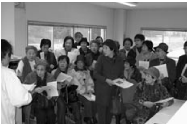
▲2月22日浄水場でわが町の水事情を学ぶ