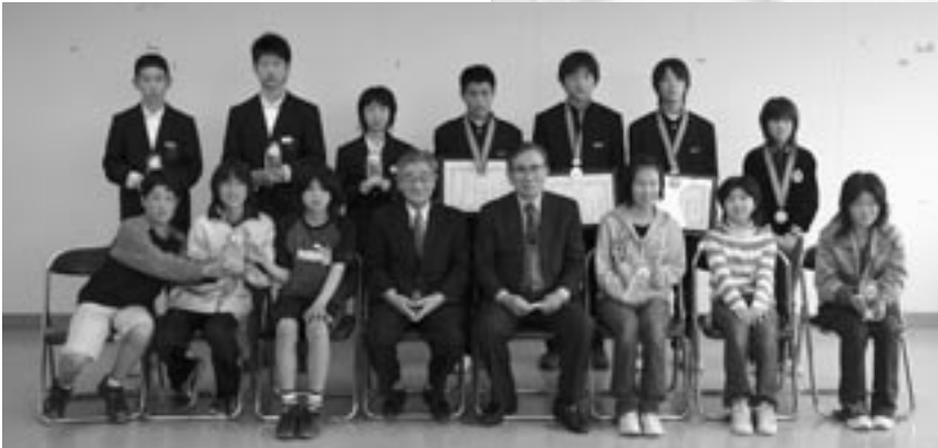
▲特別表彰・団体表彰を受けたみなさん

岡垣町教育委員会では平成15年度から「子どもの良いところをほめて伸ばしていこう」と、ボランティア活動への参加が基準回数以上の児童と生徒を表彰しています。