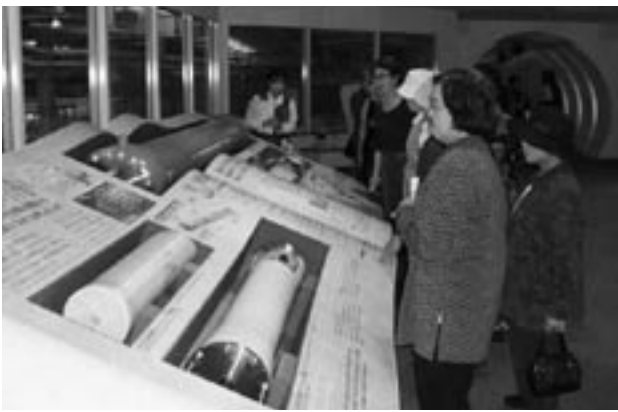
▲10月31日海の中道奈多海水淡水化センターを見学

地球温暖化が、人間をはじめ生態系に大きな影響を及ぼしている中で、森林は二酸化炭素を吸収する貴重な資源です。この森林資源を大切に守るため、割りばしの消費を抑えることが必要です。緑と自然を守るため、自分のは