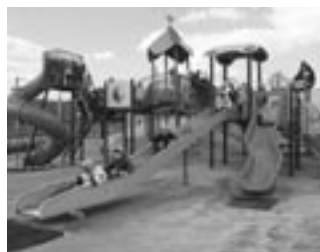
《今古賀中央公園・遠賀町》