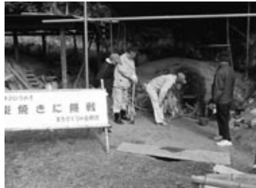
▲窯に火入れするようす