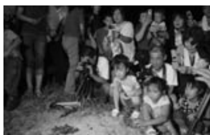
▲平成19年の様子。81匹が海に帰って行った