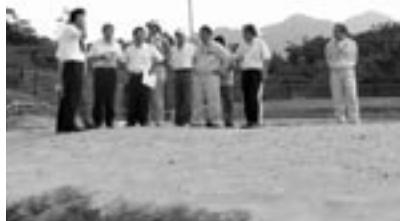
▲状況視察をする大学院教授と町職員

完全に自然のままの砂浜はごく一部。そこがウミガメの産卵場所になっているのが現状です。そこも最近潮の流れが悪くなっていると思います。砂の流動がないために植物が定着しやすくなっているでしょう。浜にどんどん生えてきている。完全な砂浜が小さくなっているんですよ。ウミガメの目線からして、海の中から「この浜は産卵場所に適している」なんてことは分からずでしょう。その場所がいいか悪いかは判断できません。本能や潮の流れに導かれて上陸し、産卵するんです。しかし人間は、産卵しやすい場所をつくらなければならないんです。 産卵場所はこれからも減っていくと思います。でもウミガメが帰ってくるという環境が町内にあるんだから、それを私たちがしっかり守らなきゃならん。そしてたくさんの人たちに、ふ化する瞬間に立ち会ってもらって、感動を味わってもらいたいです。特に子どもたちにはね。その感動を守るのも、また私たちの役目だと思いますよ。