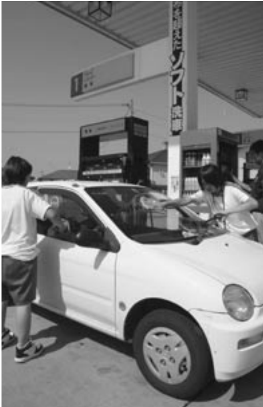
▲車の窓ふきも大切な仕事です