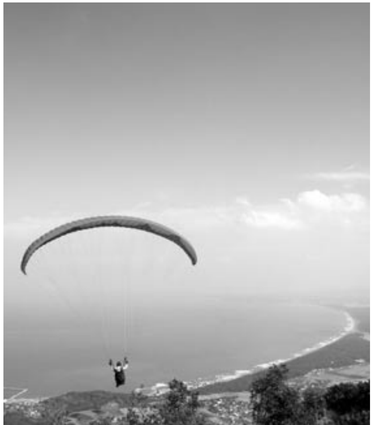
◀一面の絶景に、選手はきこつと心揺さぶられるはず