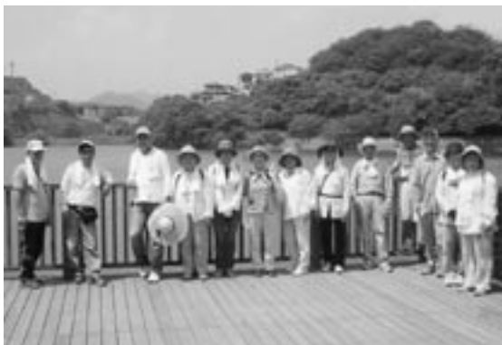
▲青年婦人部ウォーキング同好会。一丁ため池をぐるり

申し込み・問い合わせ 各区の老人クラブ会長 または同クラブ連合会(陰山) ☎283-3826 へ