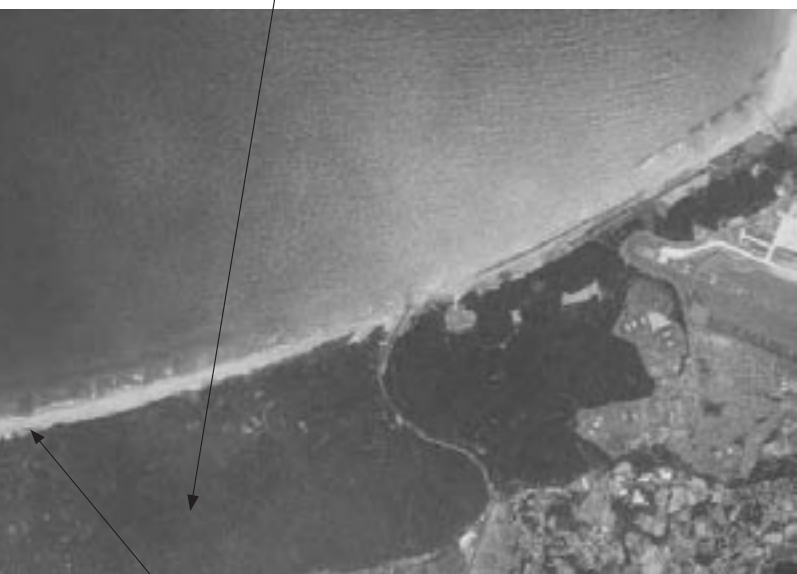
岡垣町のウミガメ産卵・ふ化状況

保全で最も大切なことは、産卵に適した砂浜を維持することです。子ガメが安全に成長して海に帰っていくには、掘り返されたり潰されたりすることがなく、波にさらわれることがないこと。それでいて、ふ化した子ガメが地表に出やすい柔らかい場所であればなりません。また、温度や湿度が適切に保たれ、呼吸に必要な酸素もある状態であればなりません。これらの条件を満たす場所は、砂浜とその先にある植物の境目あたりで、砂の深さが約30〜60センチの場所に限定されています。今年も残念なことに産卵は確認できていません。