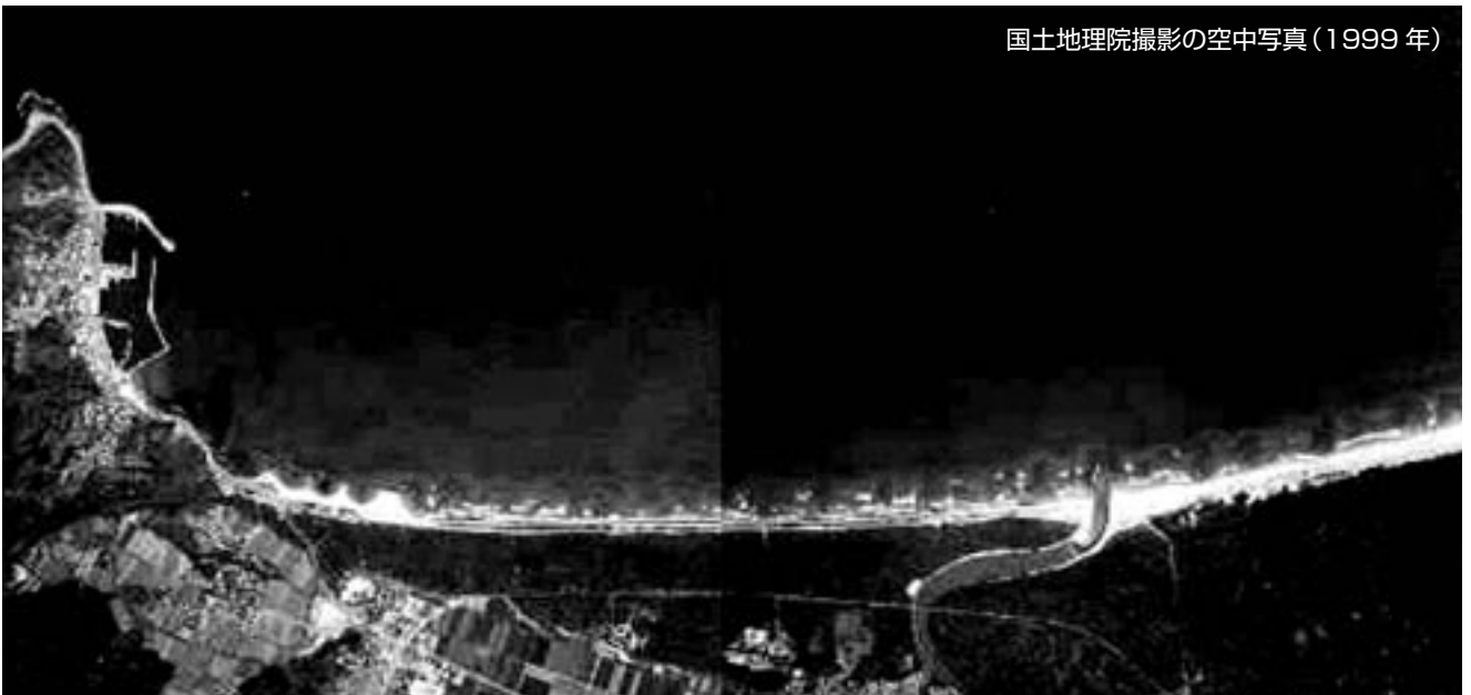
国土地理院撮影の空中写真(1999年)