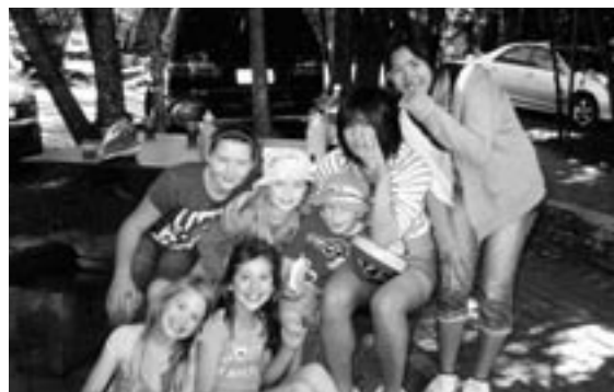
◀ 休日は、ホームステイ先の家庭とキャンプなどをして交流