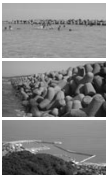
◀ 遊泳区域の境界にある離岸堤 ▲ 海岸に並んだ無数の消波ブロック ▲ 波津漁港の周囲にある防波堤