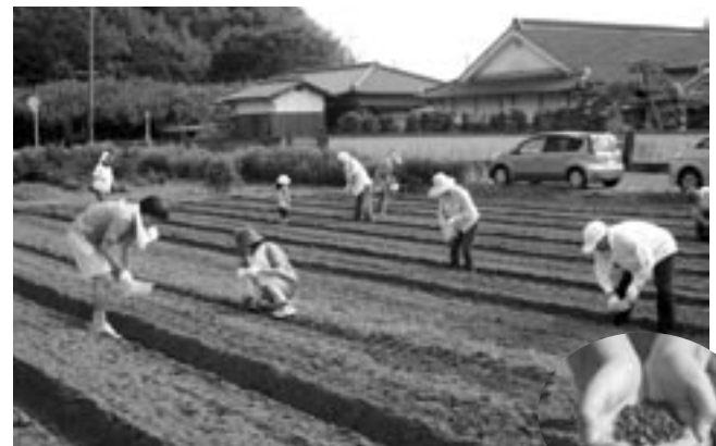
▲元気に育ってほしいですね!

町内外から19人が参加しました。この制度は、農業を体験してもらい、町の風土をたくさんの人を知ってもらいたいという目的で、上高倉地区の農業者を中心に取り組んでいるものです。