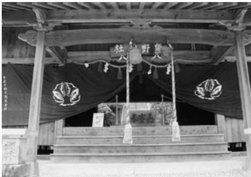
▲7月14日「祇園祭」の準備が整った熊野神社

ら何か所かで踊っていました。そ れについて行き、最後の踊りまで 見たものです。踊りが終わって獅 子頭を脱いだ人が、親戚の人だっ たことに驚いたのを思い出しま す。中学生の時、飯塚の納祖八幡 宮の祭りに行きました。そこでは お神楽もあったと思います。しか し、夜店で買った