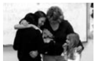
▲お別れ会では涙があふれ言葉も出なくなりました