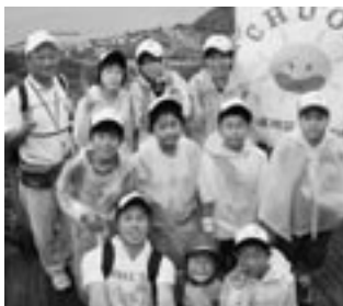
▲この体験で得たものを大切にしていってほしいですね

中間・遠賀地区内の小学4~6年生32人が参加しました。岡垣町からも8人が参加し、亜熱帯植物が生い茂る大自然の中での集団生活をして、ものの見方や考え方、人に対する思いやりや友情を学びました。