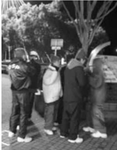
▲青少年に帰宅を促す