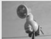
◀センサーライト。3〜5千円程度で売っています