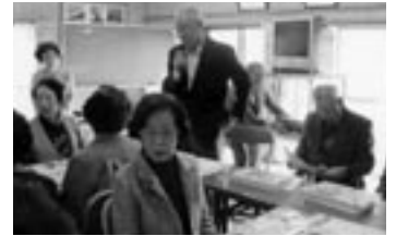
▲女性を対象にした防犯講習会(南高陽区)