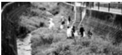
▲みんなで美しい川を守りましょう

矢矧川を清流に戻す会を中心に、岡垣町環境衛生協議会と岡垣町環境モニターが河川のごみ拾いと草刈りをしました。参加者からは「矢矧川はホテルが飛び