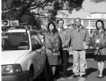
◀青色回転灯装着車と役場職員

役場の職員は週2回、小中学校の下校時に青色回転灯装着車に乗って、通学路を中心にパトロールしています。平成21年1月には、パトロールの強化と地域の団体に貸し出せるようにすることを目的に、パトロール車を購入します。 また、JR海老津駅周辺で起こる犯罪を事前に発見、防止するため、駅前広場と駐輪場に防犯カメラを設置します。それに合わせて、駅前広場にはスピーカーも設置。防犯情報の提供、啓発にも努めます。