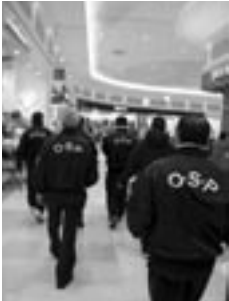
▲商業施設内もくまなく

「活動を始めたばかりのころ、声を掛けると反発する青少年もいましたが、最近は帰宅を促すと素直に聞き入れてくれることが多くなり、やりがいを感じています。これからは青少年が犯罪に巻き込まれることを防ぎ、手を染めることがないように支援していきたいですね。また、OSPでは、一緒に活動してくれる隊員を募集しています。活動に賛同して下さる人は、連絡してください」