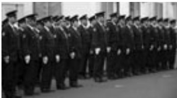
▲歳末警戒出動式で士気を高める折尾署員

強盗はコンビニエンスストアや郵便局などの商店や事業所、特に深夜が狙われやすいので、そうなる前に対策を練っておくことが重要でしょう」