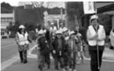
▲海老津小学校の下校時見守り活動