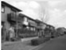
◀家の周囲にも目を配りましょう

警察や地域で活動する団体だけで全ての犯罪を事前に防止することは難しい。そしてあなたの身の回りを一番良く知っているのは、あなたです。防犯には、警察、地域、そしてあなた自身の目。たくさんの目を光らせることが、最大の防犯になるのです。現に今年の6月、高陽台で不審な男がいるという住民からの通報で警察が駆けつけたところ、ポケットにナイフを忍ばせていたので現行犯逮捕、犯罪を事前に防止できたという例もあります。犯罪は、あなたのすぐそばで起こっているというのを再認識して、隣近所との連携を強めたり、家や周囲の状況を確認したりするなどして、あなた自身の防犯能力を高めてください。