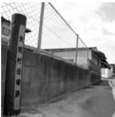
▲現在の海老津区にある矢矧村役場跡

さらに高倉にあった小学簡易科を、1893(明治26)年2月に高倉尋常小学校として校舎を新築。1898(明治31)年4月には、黒山に矢矧高等小学校も設置された。しかし、こうした学校整備が村の財政を圧迫していた様子が、当時の村役場資料にうかがえる。ともあれ矢矧村時代は、岡垣での自治行政の基礎がつけられた時期として見逃せない。