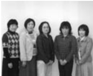
▲受講生のみなさん

地域で男女共同参画を進めるリーダーを養成するために開講しました。受講生5人で、男女共同参画を推進するリーダーの連携の手法をテーマに、自主活動に取り組んでいきます。