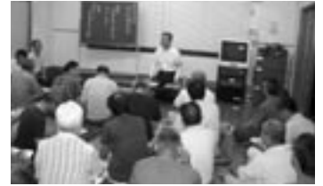
▲海老津校区コミュニティの防犯講習会