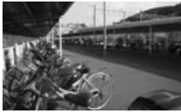
◀駅前駐輪場。防犯カメラを設置します