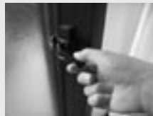
◀外出時は必ず鍵を掛けて