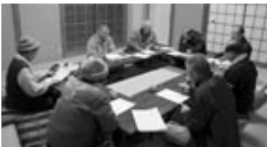
▲定期的に会議を開き、危険箇所や防犯情報を共有