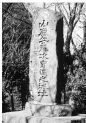
▲歴史教育の認識を変えさせた「山鹿兵藤次秀遠之城址」の碑

三里松原は、岡垣町の原から芦屋まで約12キロメートルあります。芦屋の松は、ずいぶん伐採されました。芦屋市街地が拡大する