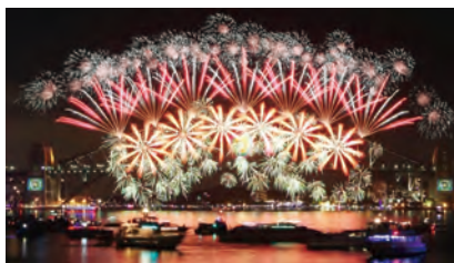
▲シドニーの大晦日の花火大会

クリスマスの次に大切な祝日は、1月26日のオーストラリアデーです。この日は、オーストラリアで大人気のラジオチャンネルが「Hottest100」と呼ばれる、前年に発売された曲から視聴者の投票でトップ100を選んだものを放