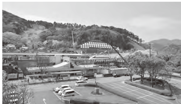
海老津駅周辺環境プロジェクト

多くの住民の交流・にぎわい創出に向けて、ブックカフェ機能を追加し、管理運営を新たに指定管理者に委託して、4月2日にリニューアルオープンしました。