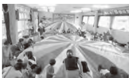
*昨年度わんぱくの様子です*