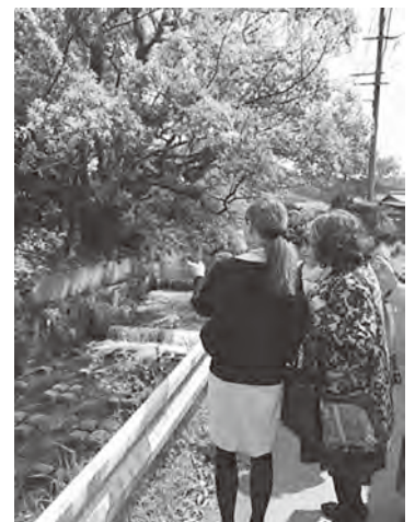
▲母と一緒にカワセミを探しました

高倉神社から龍昌寺に向かっている途中でカワセミを目撃し、町の鳥までもが歓迎してくれている気持ちになりました。