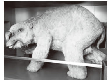
▲オーストラリア国立博物館にある「ディプロトドン」の復元標本

皆さんに一番覚えてもらいたいのは「バンイップ」より何倍も恐ろしい「ドロップベアー」です。「見た目はコアラに似ていますが、長いかぎ爪を持っている危険な肉食動物です。木の上に住んでいて、下を通る人間の頭をめぐけて落ち、襲ってきます」と言って、外国人観光客をからかうオーストラリア人がいるので、気を付けましょう。ちなみに、「ドロップベアー」は架空の動物です。