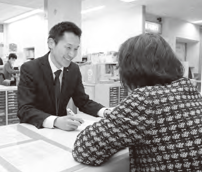
あなたに必要な支援を一緒に考えます

合事業）は、65歳以上のすべての人を対象に、町が行う介護予防事業です。これまで全国一律で行っていた訪問介護と通所介護を「訪問型サービス」と「通所型サービス」に変更します。将来的には、高齢者がいつまでも元気に自立して暮らせるように、地域の実情や一人ひとりの状態にあわせた町独自の生活支援サービスなどを加えていきます。