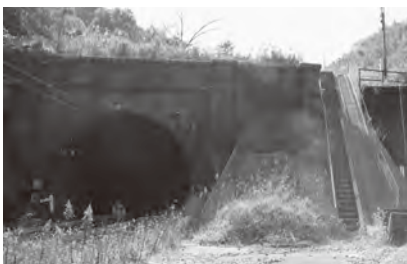
上) 美しいアーチを描く、レンガ造りの橋梁（岡垣町指定文化財） 左) 赤レンガアーチに代わり現在も鉄道の往來を支えるレンガ造りのトンネル