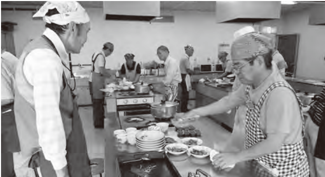
▲成人講座ゆうま(男性料理コース) ※4日(月)・18日(月)は休館日

現在、来年度に催す講座に向けて準備中です。詳しくは広報おかがき4月10日号に折り込む募集チラシを見てください。