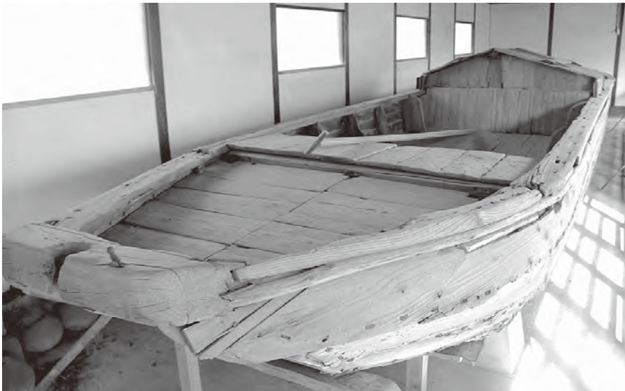
上) 芦屋町中央公民館に展示されている現存する川ひらた。「ひらた船」という名称で県指定文化財になっている 左) 川ひらたを改造した船に乗り、芦屋見物と船遊びをする香月町(現在の八幡西区)の貝島大辻炭坑の職員

現存する川ひらたは2艘だけだといわれ、芦屋町中央公民館と県立折尾高校(北九州市八幡西区)に1艘ずつ保存されています。