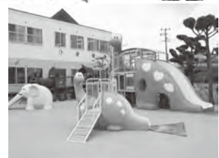
恐竜ももちゃん・ななちゃん