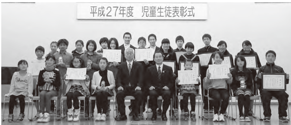
平成27年度 児童生徒表彰式