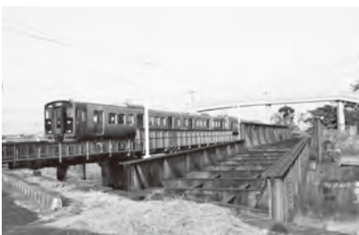
左) 手前の橋梁が室木線跡。奥は鹿児島本線下り