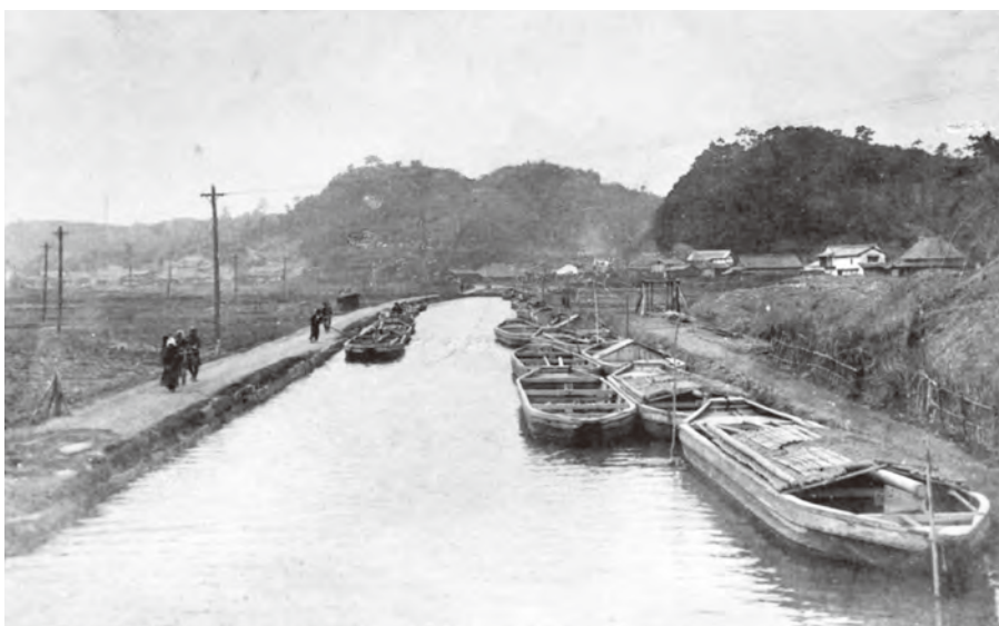
上) 明治時代中期の水巻町吉田付近。堀川に多くの川ひらたが付けられている 左) 大正時代の河守神社前(水巻町吉田東)の堀川。川ひらたが帆を揚げるのは珍しい

遠賀川から洞海湾までの水運を可能にした堀川は、地域の石炭産業を活性化させ、それが官営八幡製鐵所の誘致へとつながっていききました。