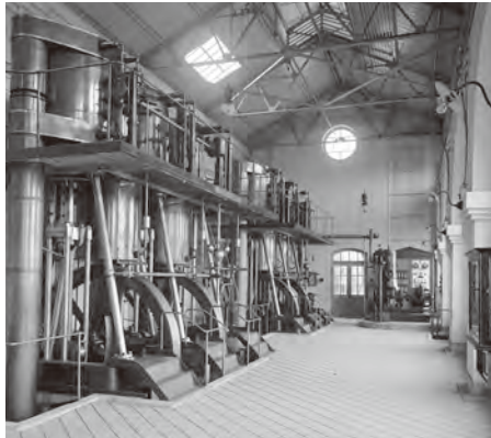
上) 新日鐵住金(株)八幡製鐵所まで、毎日12万トンの水を送っている鉄管道路 下) ヘイソーン・デビー社製の蒸気エンジンポンプ。ポンプの高さは地上5m、地下2mにもなる 左) 世界文化遺産に登録された構成資産の一つ、遠賀川水源地ポンプ室

鉄鋼業に欠かせない「水」を送るポンプ室 遠賀川水源地ポンプ室は、官営八幡製鐵所の施設として、明治43(1910)年に建設されました。当時、製鐵所の鉄鋼業は国が進める近代化の柱として重要視され、鉄鋼の生産量を2倍にする計画がありました。この計画に欠かせないのが「水」。その水を遠賀川から製鐵所まで供給し続けている