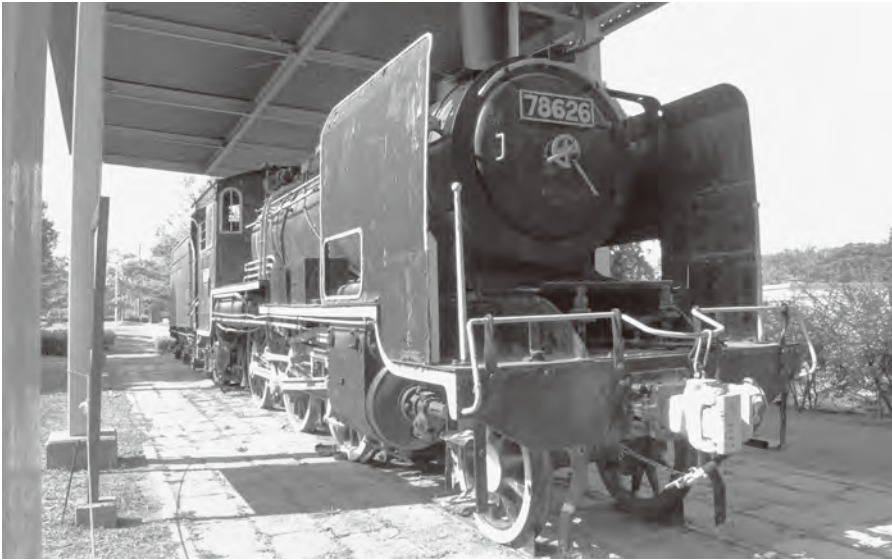
上) 遠賀川駅を発着していた8620形の蒸気機関車。活躍していた当時の姿のまま遠賀総合運動公園に展示されている

石炭産業の黄金時代に重要な役割を担っていた遠賀川駅。基幹駅としてさまざまな路線をつなげていたのです。