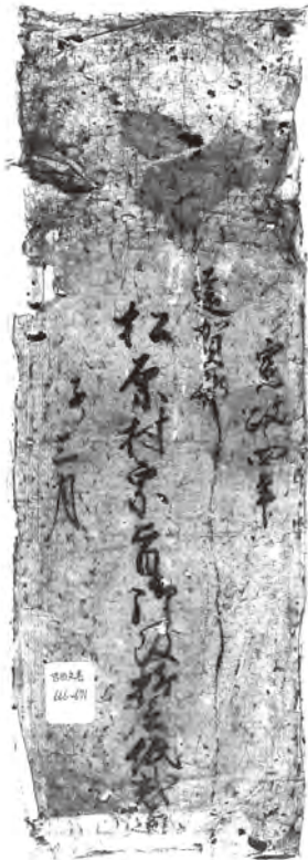
『吉田文書』収載の起請文封筒