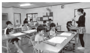
▲音楽教室では発表会に向けて楽器の演奏を練習します

A 子どもたちが私の名前を覚えて、外で会ったときに声を掛けてくれることがとてもうれしいです。また、子どもたちがたくさん質問してくるので、それに答えようと私も勉強しています。子どもたちのおかげで、私もさらに学ぶことができます。