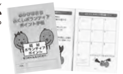
▲研修会に参加した人にポイント手帳を配ります

ためたポイントは商品券や町の特産品などと交換できます。この機会に、福祉ボランティアとして活動しませんか。