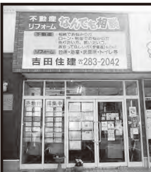
旧3号線沿い茅原信号すぐ側