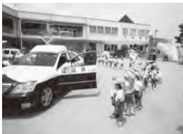
《防犯訓練・給食のひとこまです》