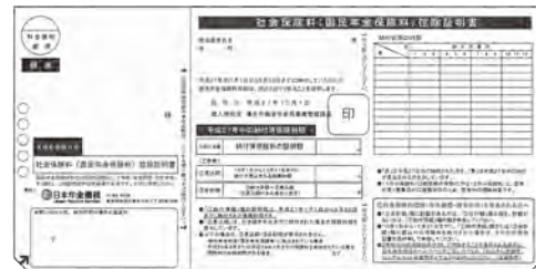
◀控除証明書(イメージ)

問い合わせ ①ねんきん加入者ダイヤル ☎0570-003-004 (050から始まる電話番号の人は03-6630-2525へ) または②八幡年金事務所 ☎631-7962へ ※①は11月1日(火)～平成29年3月15日(水)